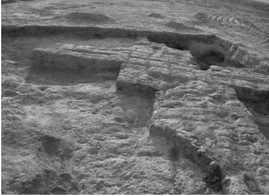
القطاع: M سوية العصر الهيلينستي

الجدار الشمالي لهذا الحيز ( 13279 ) له اساسات عميقة تتكون من الطين المكوك وقد عثر الى الجنوب الغربي من هذه الغرفة 13279 على حيز صغير مربع الشكل تقريبا يتضمن تنور.