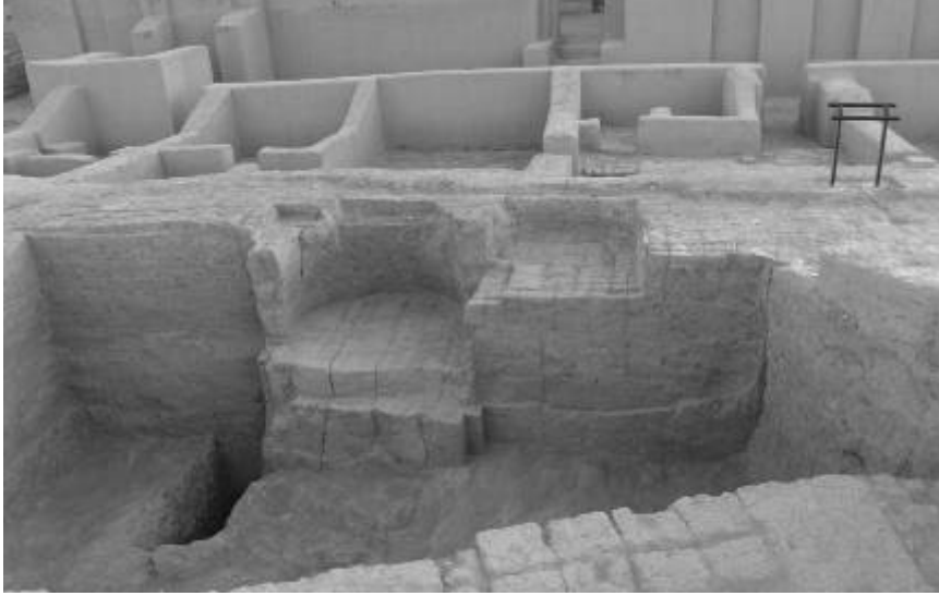
القطاع M الزاوية الشمالية الغربية للمبنى العائد لعصر الجزيرة

- الجدار الغربي للحيز (الغرفة) 13254 ) الذي يقع في الزاوية الشمالية الغربية من المبنى مزين بكوة ( niche ). اما بالنسبة لبقية غرف واجزاء هذا المبنى فانها لم تحفر بشكل كامل ولكن بالقابل فان هذا المبنى يؤرخ بشتى الاحوال لفترة عصر الجزيرة IIIb