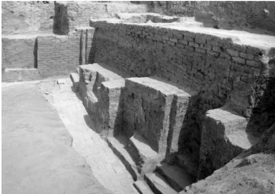
الجدار الشرقي للباحة 14112, الى اليمين في العلى نلاحظ اساسات سوية عصر الجزيرة IVa

الجدار الشمالي 14222 للساحة الرئيسية تم الكشف عن اقسام كبيرة منه خلال الموسم الماضي, يبلغ طول هذا الجدار 16,45 م ويشكل هذا الجدار مع البوابة ذات الادراج البازلتية الطرف الشمالي للساحة و الذي يبلغ طوله 18,50 م . سماكة الجدار تبلغ 1,30 سم أي بعرض 4 لبنات وهو مزين بعضاضات تفصلها 5 كوات ( niches ) لكل منها مصطبة منخفضة .